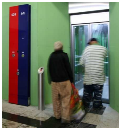
Aufzug des Monats Februar 2015, Windscheid und Wendel, Düsseldorf